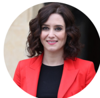
Dña. Isabel Díaz Ayuso Presidenta de la Comunidad de Madrid