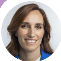
Dña. Mónica García Gómez Ministra de Sanidad