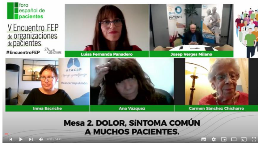
Mesa 2 | Dolor, síntoma común a muchos pacientes