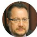
Baquero JL 3