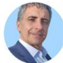
Mateos C 4

6 abril | Reunión Ministerio de Dirección Salud Pública