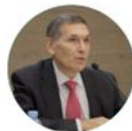
Chivato T 2