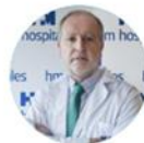
Barberan J 1