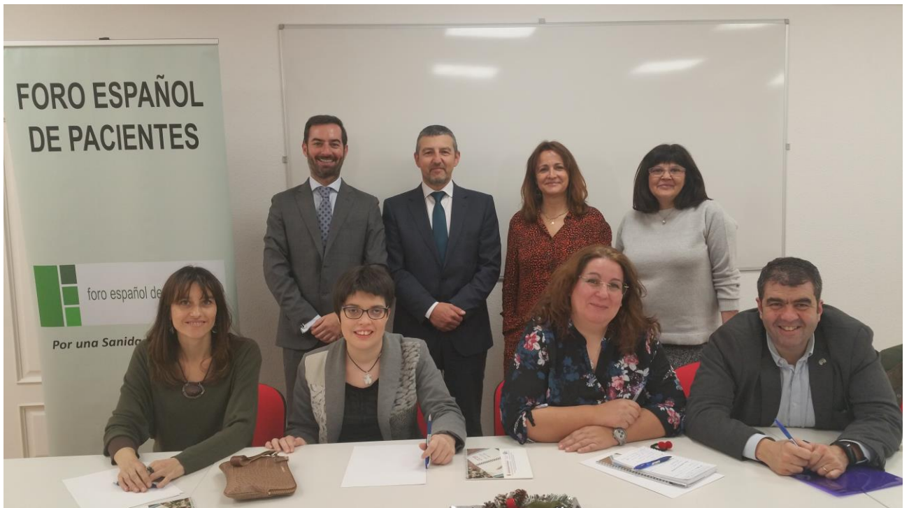
Reunión Junta Directiva del FEP (tarde del 17/12/2018)