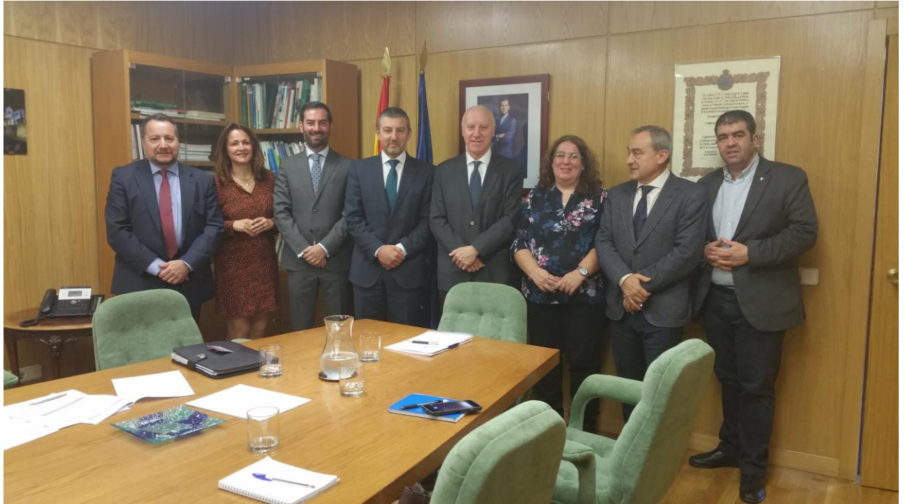
Encuentro en MSCBS (mañana del 17/12/2018)